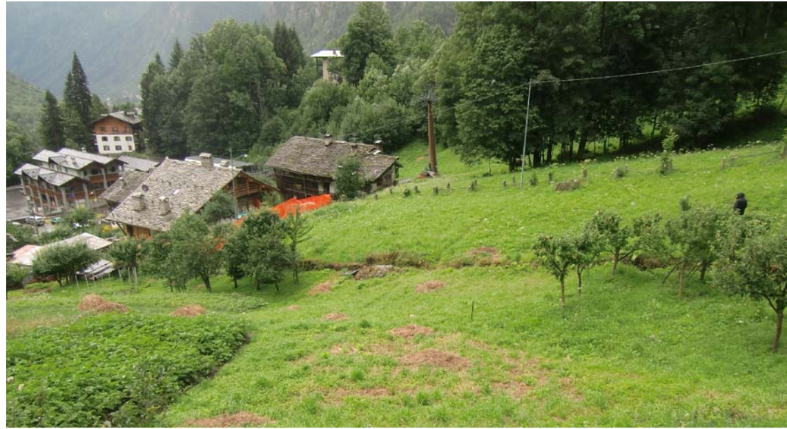
Tratto intermedio della variante