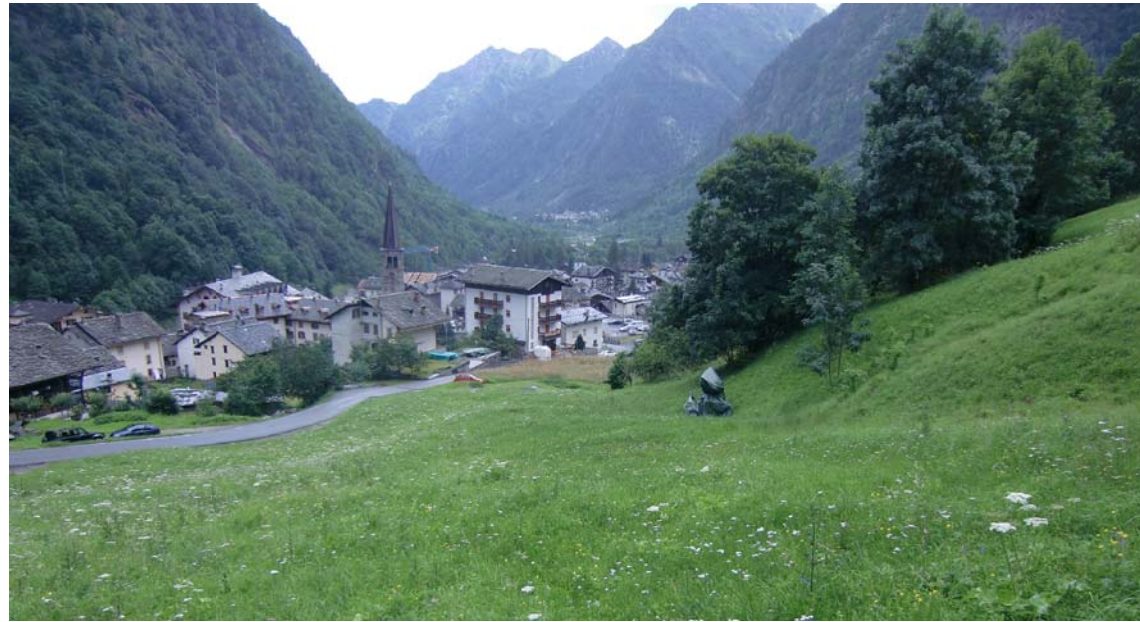
Tratto di monte della variante