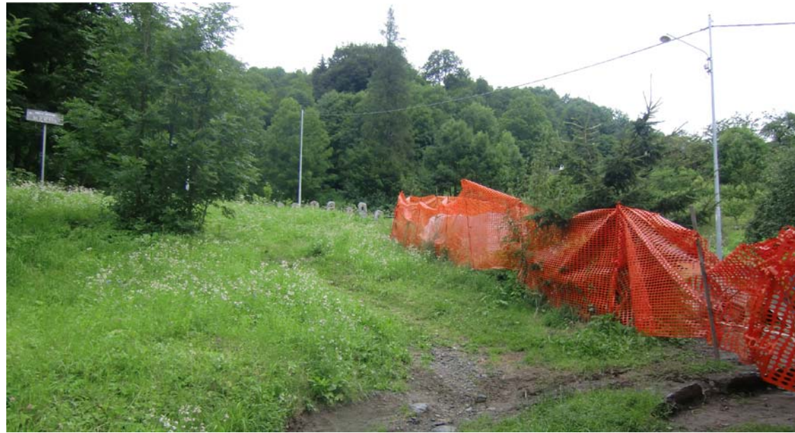
Tratto di valle della variante